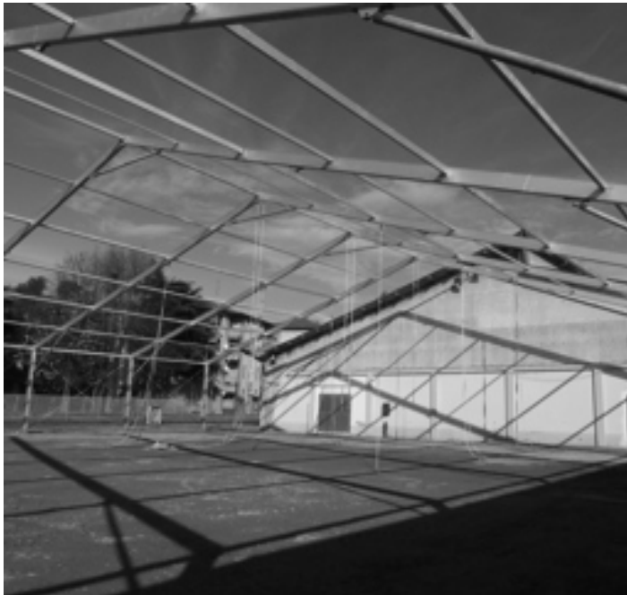
Le immagini della zona della fiera in cui è avvenuto l'incidente e i soccorsi