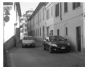
Via Cabrini, al centro delle polemiche

Trattandosi di un'arteria che conduce in centro, il via vai è continuo e a ogni ora del giorno, interessa cittadini e gente da fuori, soprattutto anziani, donne con bambini e ragazzi: sono loro a percorrerla più di frequente per il semplice fatto che in pochi metri via Cabrini concentra l'oratorio San Luigi, il centro di raccolta Caritas e la casa di cura Columbus. «Uscendo dall'oratorio i bambini si trovano la visuale sbarrata dal cofano delle auto parcheggiate e con quelle che vi passano ve-