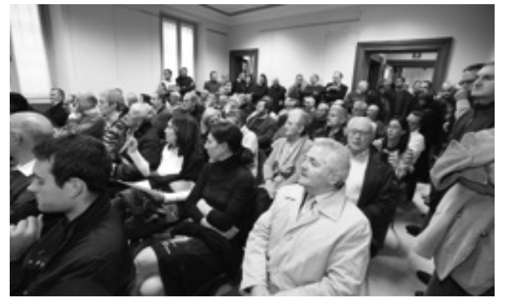
Il pubblico intervenuto sabato all'assemblea del centrosinistra a Codogno